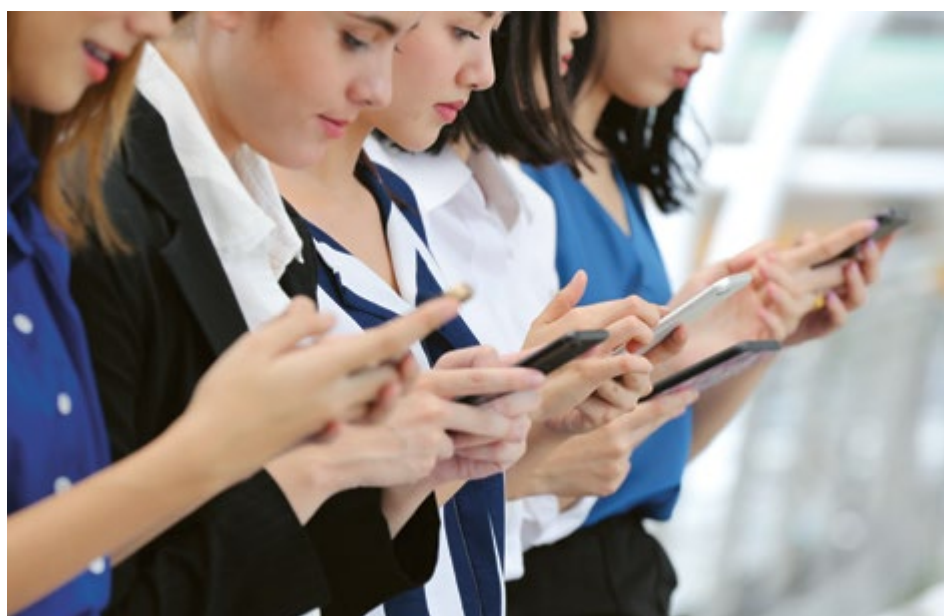
I giovani organizzano la loro vita col telefonino.

L'impegno per una maggiore presenza su Internet ha anche contribuito all'aumento del numero di richieste di aiuto pervenute alla centrale di emergenza dell'ASMB: + 4% nel 2018, + 17% da inizio 2017.